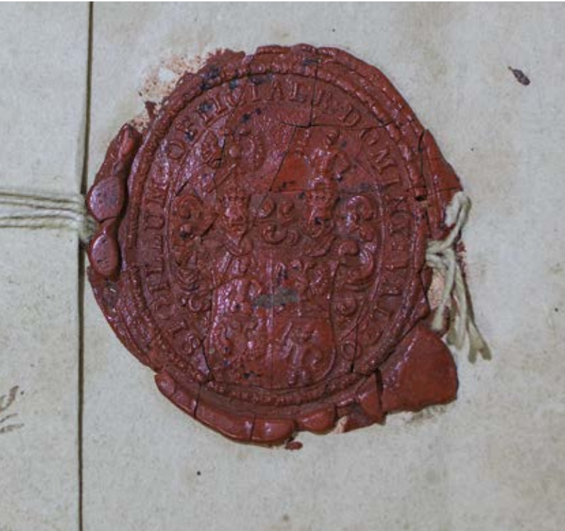
Sl. 2. Najstariji pečat Valpovačkog vlastelinstva (1731.), otisak na naslovnici Knjige maltarine 1731. – 1737., detalj izložka br. 98.